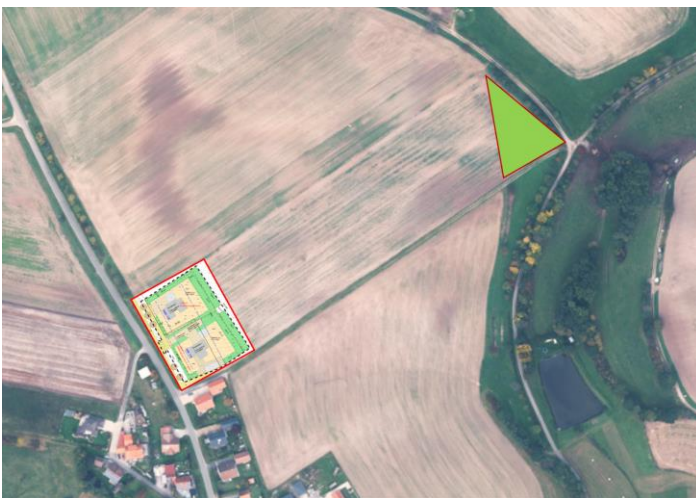
Lage im Raum mit Ausgleichsfläche